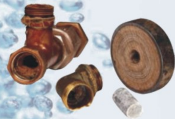
Conducta si accesorii colmate